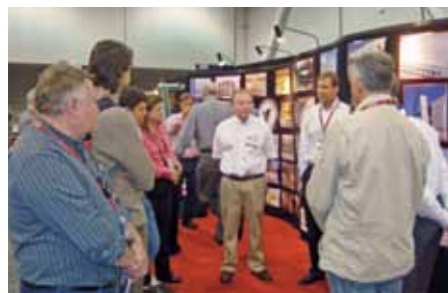
Delegação Abcic em reunião no estande de equipamentos durante a World of Concrete.

A delegação prestigiou a feira World of Concrete, visitou fábricas, participou do Congresso organizado pela National Precast Association e das ações promovidas pelo PCI