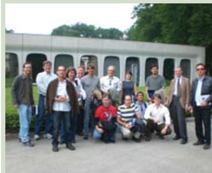
Delegação formada pelos 15 integrantes da associação, em frente a empresa Ergon, na Bélgica