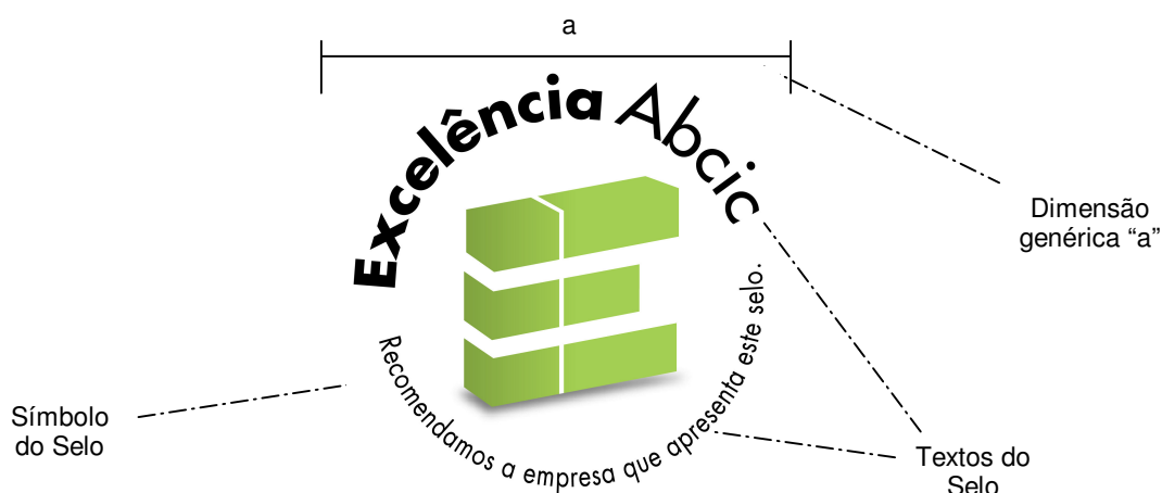
Figura 01 - Características do Selo Excelência ABCIC

O selo deve ser impresso em tamanho compatível com a documentação ou material publicitário que o contenha, atendendo aos padrões de forma e dimensão identificadas na figura 01, conforme descrição do arquivo eletrônico “Logotipo ABCIC - Normas de Aplicação”, fornecido para a empresa após credenciamento inicial. As dimensões estão baseadas em uma medida padrão (a) descrita neste arquivo.