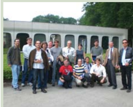
Delegação formada pelos 15 integrantes da associação, em frente a empresa Ergon, na Bélgica